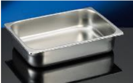
Vasija de 8 lts 36 x 25 800.00 MXN