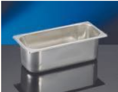
Vasija de 5 lts 36 x 16 600.00 MXN